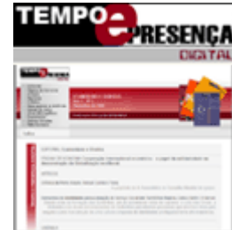
Ecumenismo e Direitos Ano 1 Nº 2